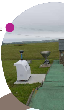
La station de surveillance atmosphérique regroupe les équipements de contrôle de l'air de la pluie et du vent.