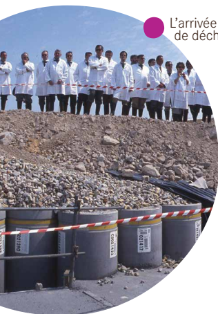
L'arrivée du dernier colis de déchets en 1994.

Aujourd'hui, le centre ne reçoit plus de colis de déchets mais continue de faire l'objet d'une surveillance active, de contrôles permanents et d'études et de R&D. De nombreux aménagements et adaptations sont apportés en vue d'une fermeture définitive d'ici une cinquantaine d'années.