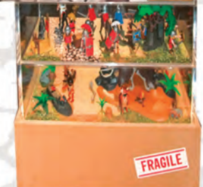
Frise chronologique et scènes de différentes époques composées avec des PLAYMOBIL®