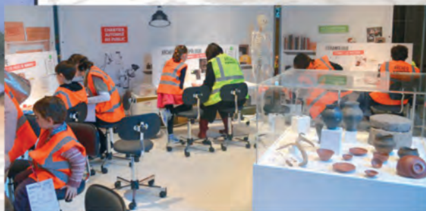
Un laboratoire pour identifier les objets découverts : poterie, squelettes animaux et humains, restes végétaux et monnaies