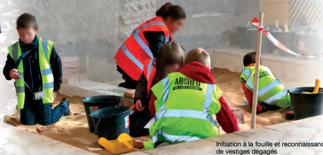
Initiation à la fouille et reconnaissance de vestiges dégagés