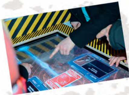
Un décor de chantier, quelques panneaux, des maquettes et des jeux

Pour répondre à ces questions, partez à l'aventure dans l'exposition et son chantier de fouilles. Grâce à votre truelle et de nombreux dispositifs interactifs, dégagez des vestiges (os, poterie, monnaie, graines, ...). Puis dans un laboratoire, étudiez-les, identifiez-les et faites-les « parler ». Le métier d'archéologue n'aura plus de secret pour vous.