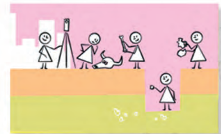
Des films d'animations sur les métiers de l'archéologie et sur la vie chez les Gaulois, les Romains et au Moyen Âge