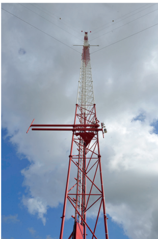
Station atmosphérique de l'Observatoire pérenne de l'environnement

Dans la perspective de l'implantation de Cigéo sur le territoire de Meuse/Haute-Marne, l'Andra et l'Université de Lorraine, ont également souhaité collaborer afin d'inscrire cette installation dans un bénéfice partagé du territoire.