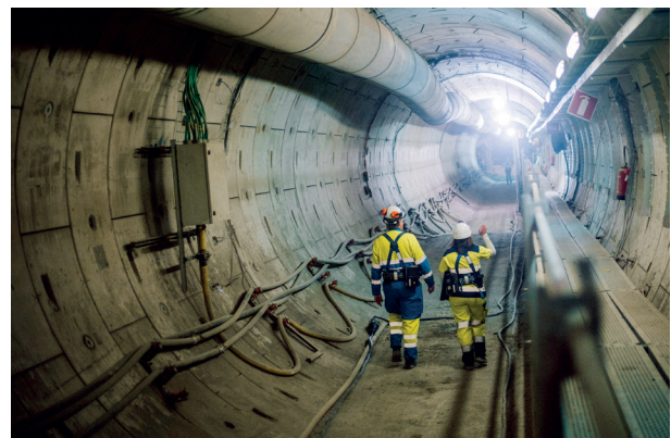
Galerie du Laboratoire souterrain de Meuse/Haute-Marne de l'Andra

L'Andra dispose quant à elle de savoirs, de savoir-faire et d'outils dans le domaine de la gestion des déchets radioactifs et en particulier dans les domaines scientifiques et techniques du stockage des déchets radioactifs en milieu géologique profond argileux, qui peuvent être utiles et valorisés dans d'autres domaines.