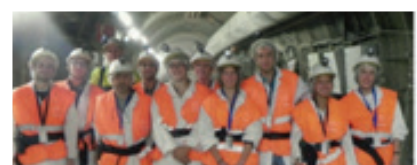
Visite du laboratoire souterrain des élèves de l'option eau et environnement