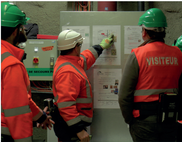
Stage du POCES au Laboratoire souterrain