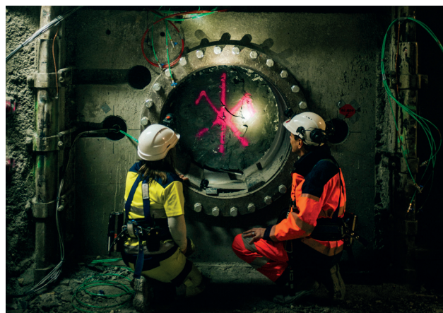
Tête d'une alvéole test HA dans une galerie du Laboratoire souterrain