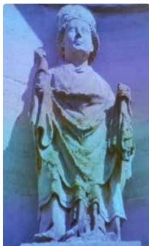
Saint Hilaire, à Chevillon.