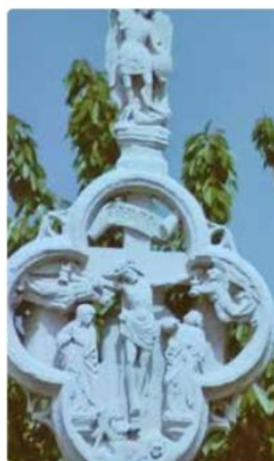
A Curel, une croix quadrilobée.