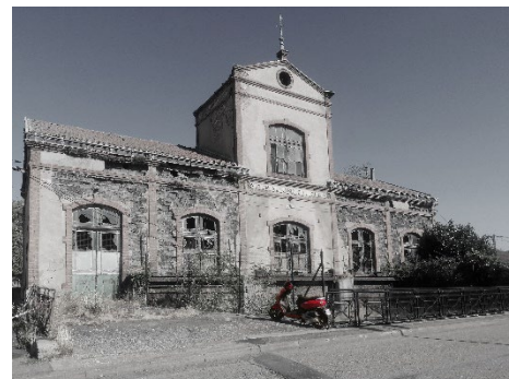
3 e prix : « Station électrique de Champy » - Elyne BIHAKY (Meurthe-et-Moselle)