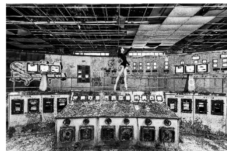
3 e prix : « 05h07 » - Laurent NISI (Moselle)