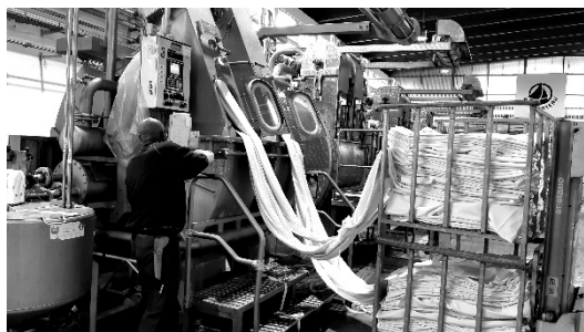
1 er prix : « On est dans de beaux draps » - Lucie SCHMITT (Aube)