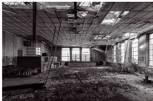
2 e prix : « La nature s'invite au réfectoire » - Timéo CHRISTOPHE (Meurthe-et-Moselle)