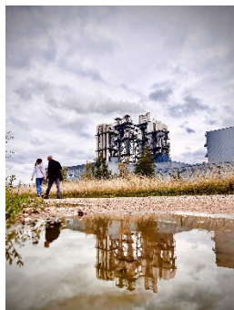
1 er prix : « UNILIN et sa face cachée » - Léa FREROTTE (Ardennes)