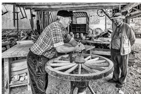
« Objet Merveilleux et Fascinant, la Roue » de Virginie THIBAUT (Meuse)